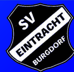
Mitgliederzusammensetzung Stand: 31.12.2018